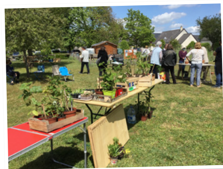
Mai : bourse aux plantes au jardin partagé.