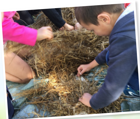
Juin : animations autour du lin au jardin partagé.