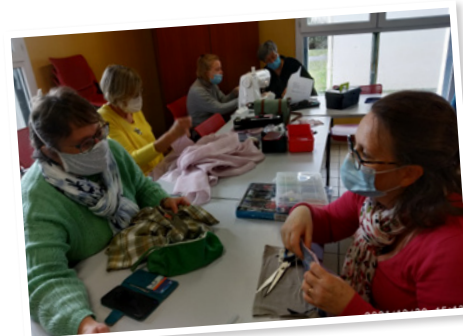
Depuis octobre : atelier mensuel de réparation up cycling couture.