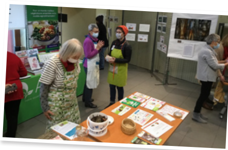
Novembre : événement et ateliers pour la semaine européenne de réduction des déchets.