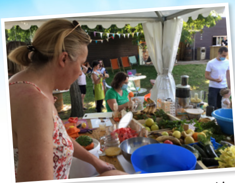
Juillet : organisation animation smoothies à la guinguette de la passerelle.