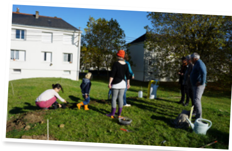
Novembre : plantations de haie de petits comestibles et mellifères quartier de la Croix Blanche.