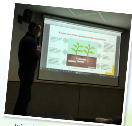
Juin et novembre : conférences.