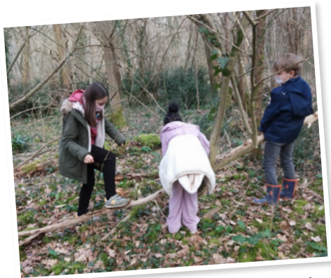
Février : fabrication de cabane au bois des Bredins.