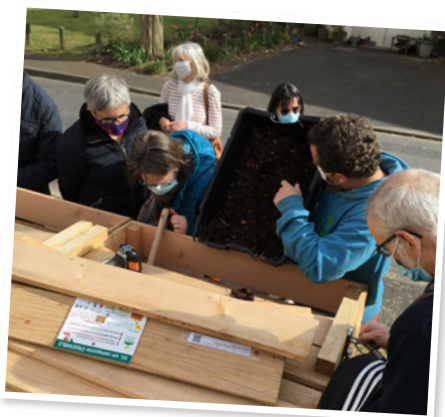
Mars : inauguration du composteur collectif du quartier de la Croix Blanche.