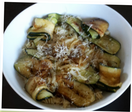
Juin : défi alimentation : pourquoi et comment devenir flexitarien.