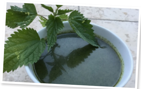
Octobre : dégustation soupe à l'ortie à la fête de l'automne et randonnée avec l'association jumelage Appenweiher et l'UCM.