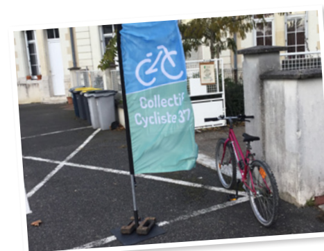
Octobre : création de l'antenne du CC37 à Montlouis avec la P'tite Brosse.