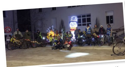
Décembre : balade des illuminés à vélo.